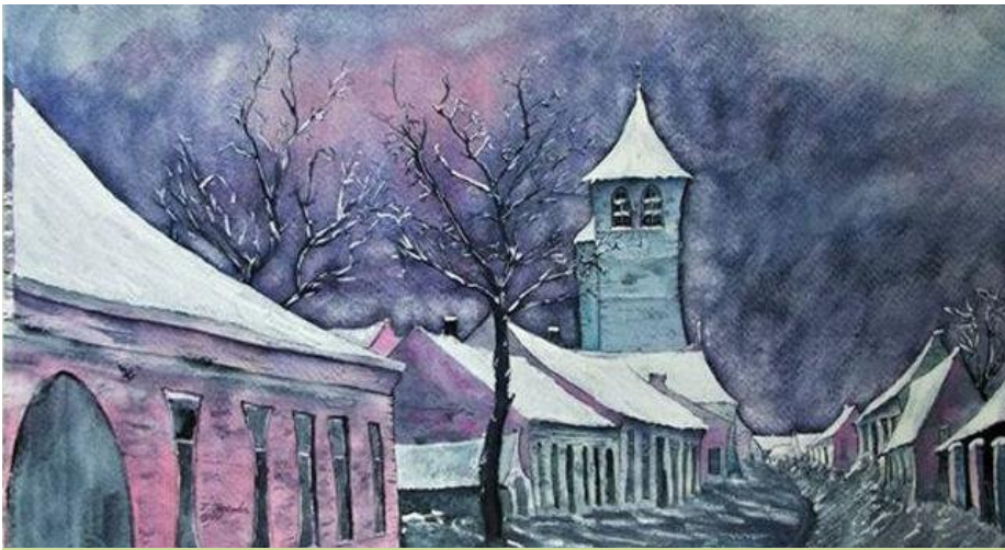
Foto: Maasbree, in heden en verleden (schilderij gemaakt door Jan Jacobs)