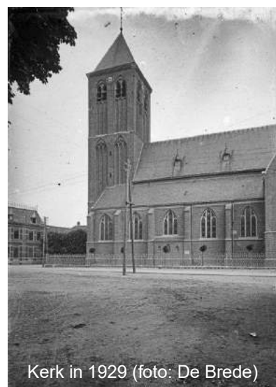
Kerk in 1929